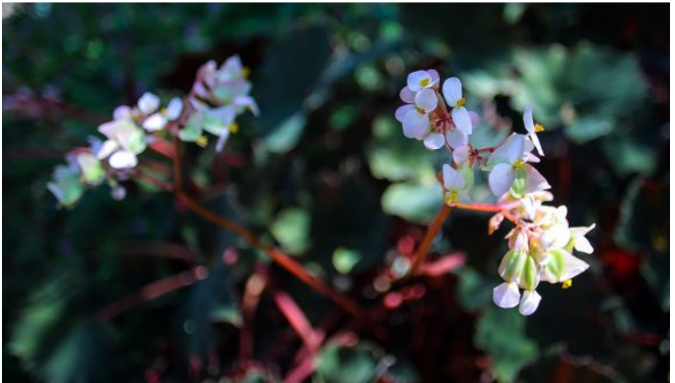
Olor a campo.