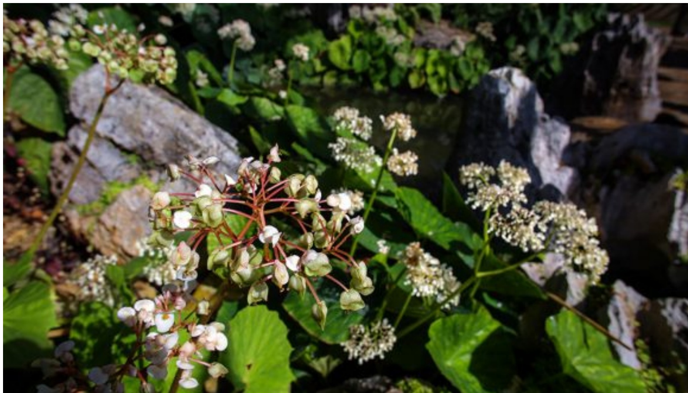
Paisaje campestre.

La ciudad a veces nos absorbe con su cotidianidad; su andar feroz nos roba mucho más que tiempo y cuando alzamos la vista ya ha pasado otro año y nosotros, sin darnos cuenta, seguimos su ciclo como ciudadanos.