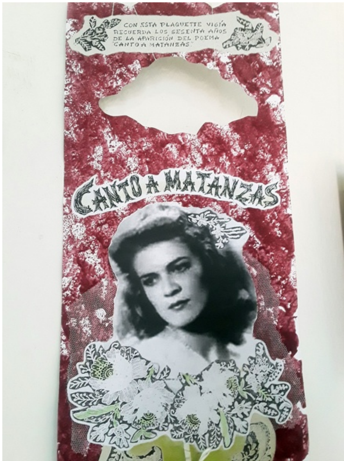
Portada del libro de Carilda Oliver Labra «Canto a Matanzas».

Carilda Oliver Labra Ediciones Vigía Matanzas Literatura Matanzas Premio Nacional de Literatura