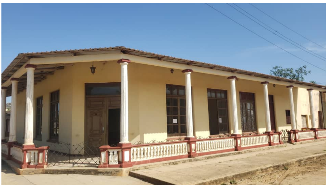
Casa de Cultura Guanajayabo.

“Agradezco infinitamente el apoyo de los amigos que trabajaron junto a mí. La Casa de Cultura en una comunidad debe revolucionar todo; es preciso aprovechar las potencialidades, respaldar la labor del movimiento de artistas aficionados, investigar y, sobre todo, ponerle el alma a la promoción de cada actividad.