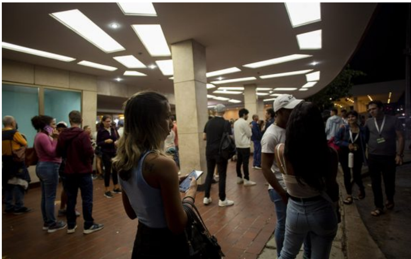
El Cine Yara durante el Festival Internacional del Nuevo Cine Latinoamericano.