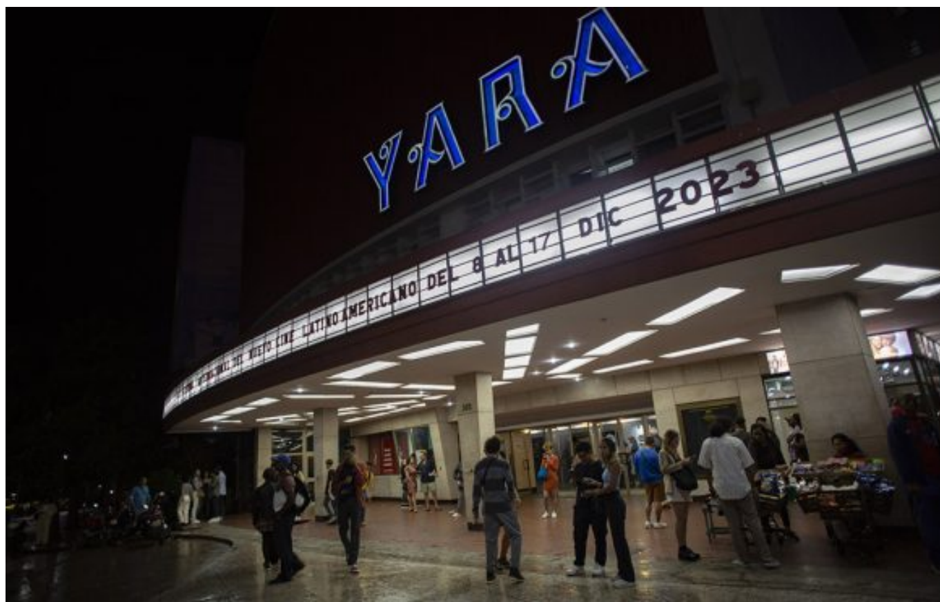
El Cine Yara durante el Festival Internacional del Nuevo Cine Latinoamericano.