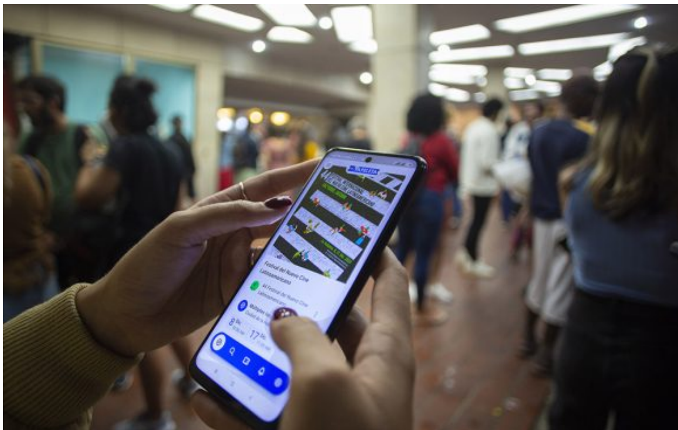
La Papeleta.