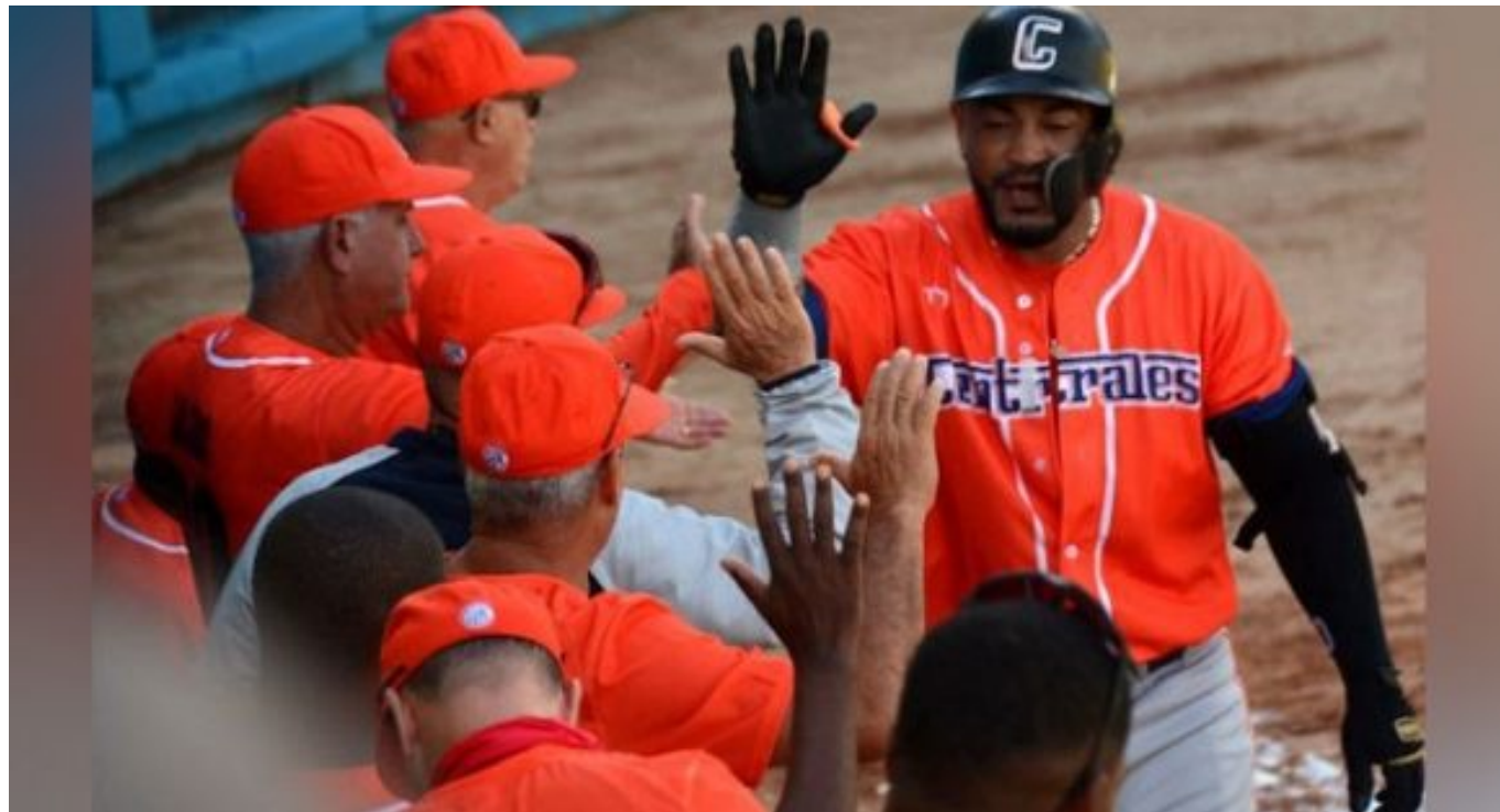
Equipo Centrales en la Liga Élite de béisbol cubano.